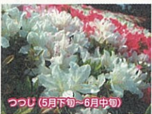
つつじ(5月下旬~6月中旬)