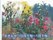
さざんか(10月下旬~1月下旬)