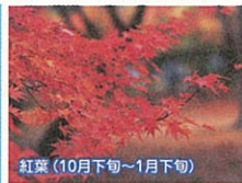
紅葉(10月下旬~1月下旬)