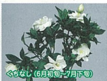
くちなし(6月初旬~7月下旬)