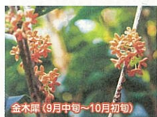
金木犀(9月中旬~10月初旬)

川西大霊苑が選ばれる理由の一つが、豊富な植物を季節毎に見ることができるところです。一年を通して、草花が咲いているので、ご先祖さまも寂しくないでしょう。お参りをしながら、あずまやで休憩をしながら、四季折々の草花を楽しむことができます。