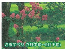
ざるすべり(7月中旬~9月下旬)