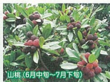
山萩(6月中旬~7月下旬)