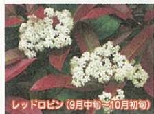
レッドロビン(9月中旬~10月初旬)