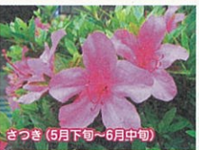
さつき(5月下旬~6月中旬)