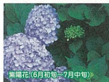
紫陽花(6月初旬~7月中旬)