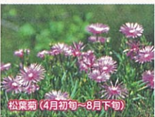
松葉菊(4月初旬~8月下旬)