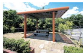
あずまや・ご休憩や団らんに