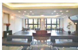
ロビー・待ち合せやご休憩に

設備が充実した管理棟、法要室、会食室があり、各種ご法要を一貫してサポートいたします。