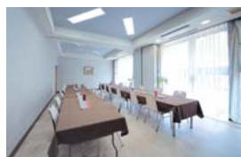
会食室・陽光あふれる洋室