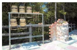
水汲み場・杓、手桶を完備