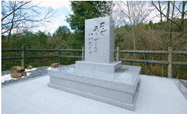
永代供養「合祀墓」 平成29年4月完成

川西大霊苑は心地よい風を感じる、木漏れ日の輝くさわやかな初夏を迎えました。自然に恵まれたこの聖地で、ご先祖さまと語り合う大切なひと時を心やすらかに過ごして頂くため、