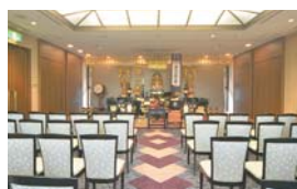
祭場・各種法要が営めます