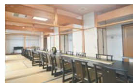
会食室・落ち着いた和室